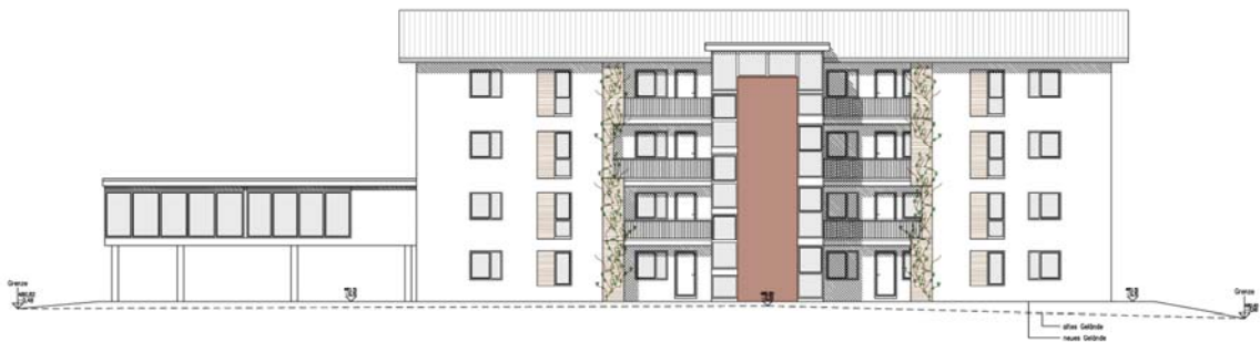
Ostansicht Haus 2