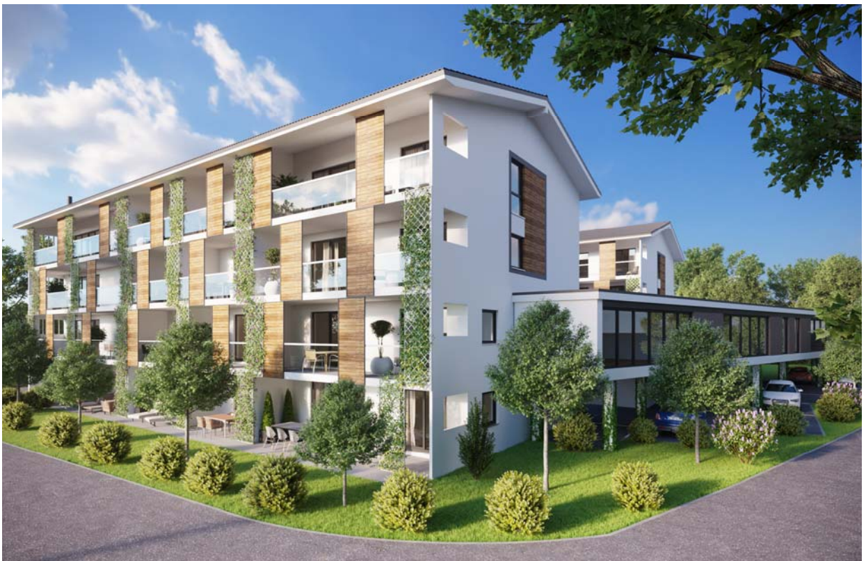
Wohnhaus und Gewerbe