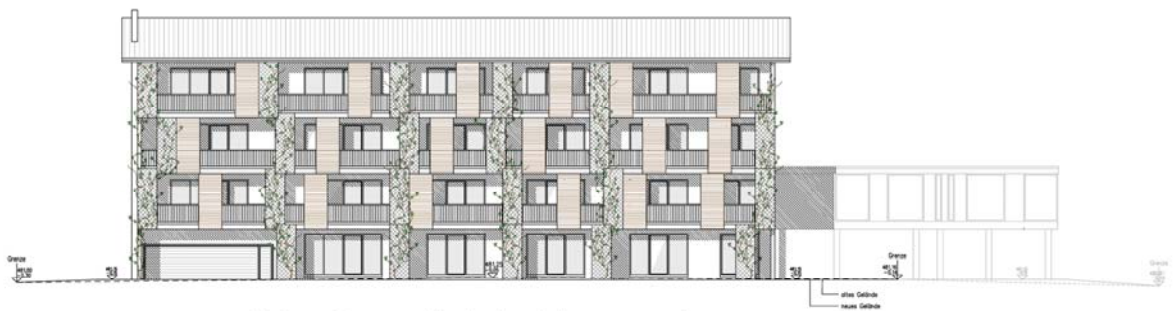
Westansicht Haus 1