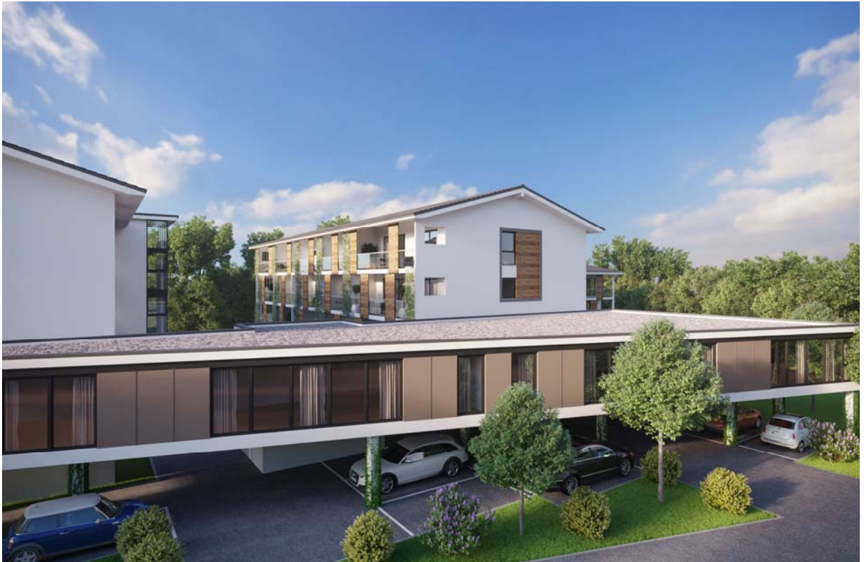
Gewerbe und Parkplatz