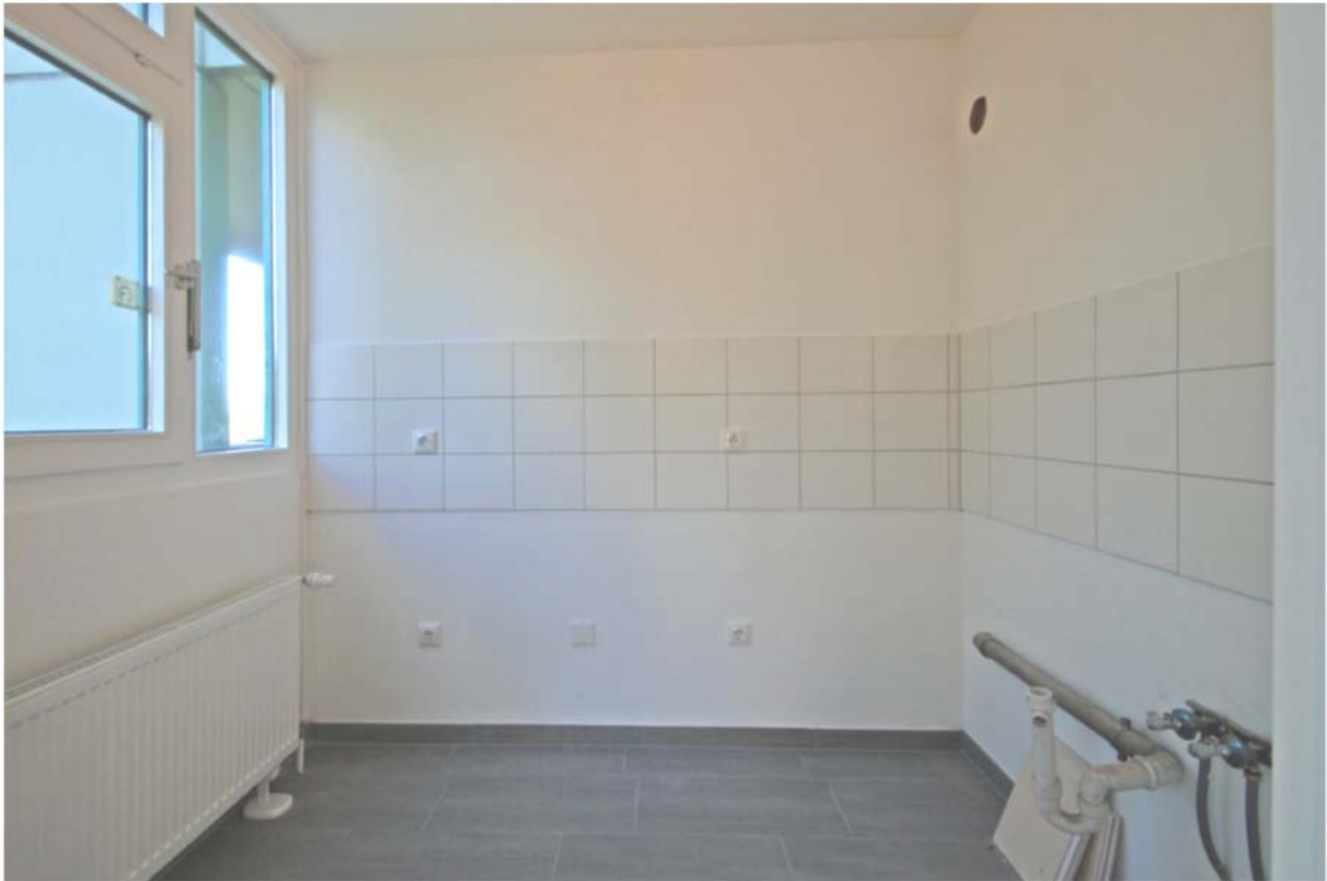
Küche (EBK wurde zwischenzeitlich eingebaut)