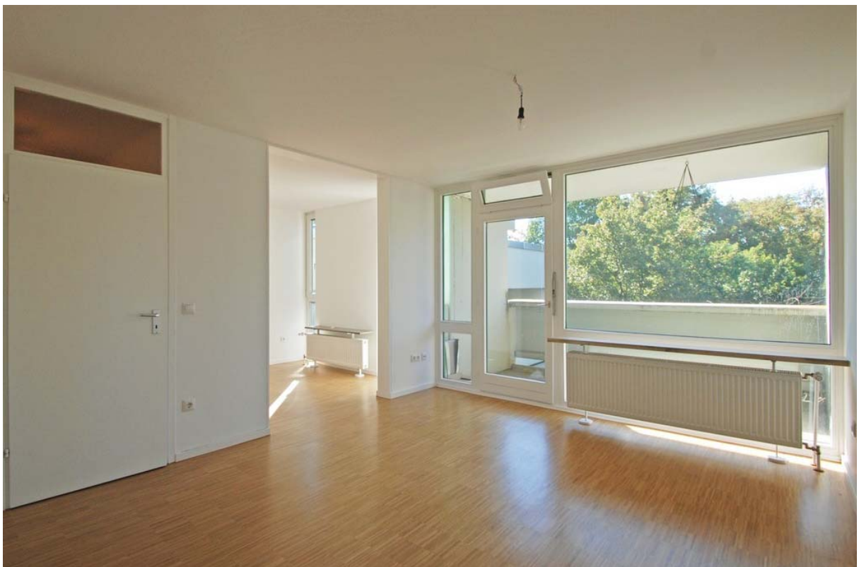
Wohn- und Schlafbereich