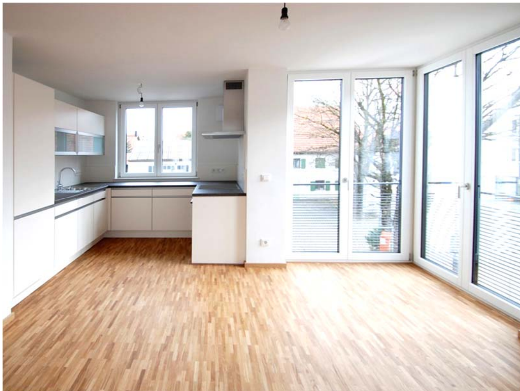
Essbereich und Küche

RITTER Bauträger & Immobilien GmbH Tel. 089 / 444 55 66 0 Fax 444 55 66 10 e-mail: info@ritter-bautraeger.de