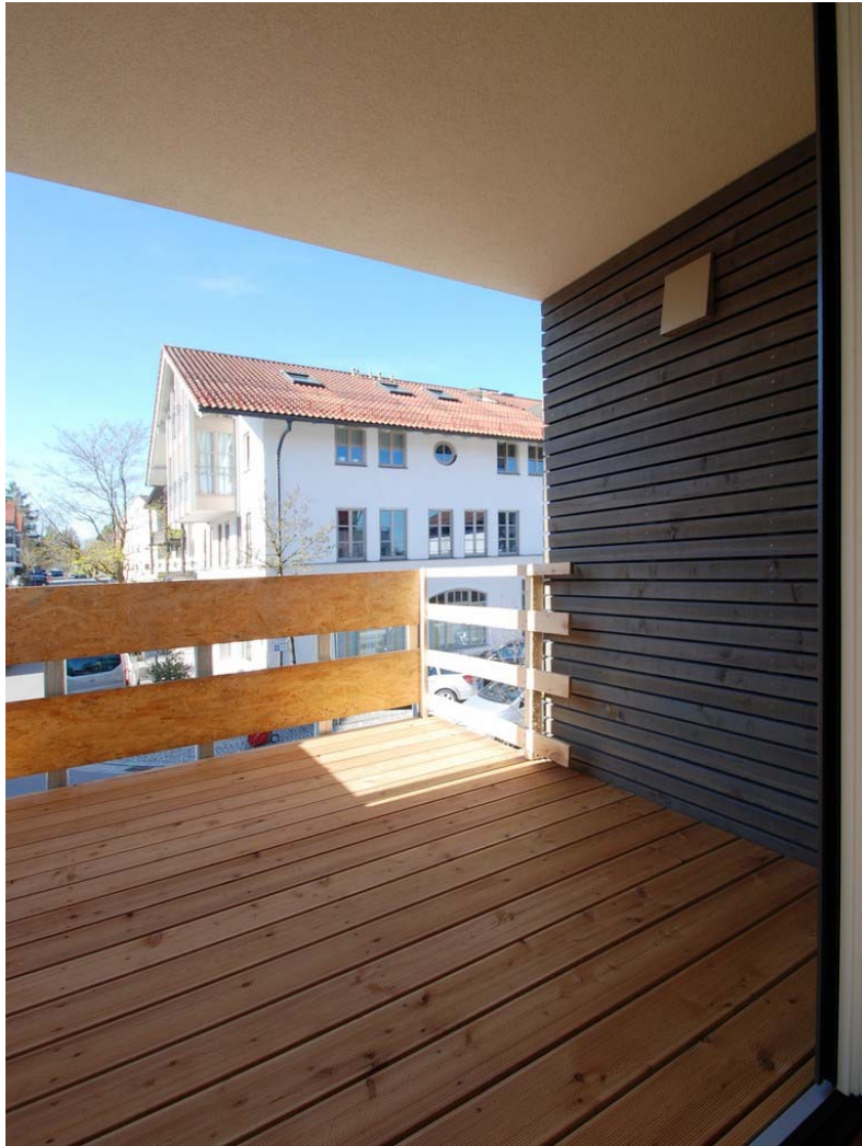
Loggia (Foto noch aus der Bauphase)