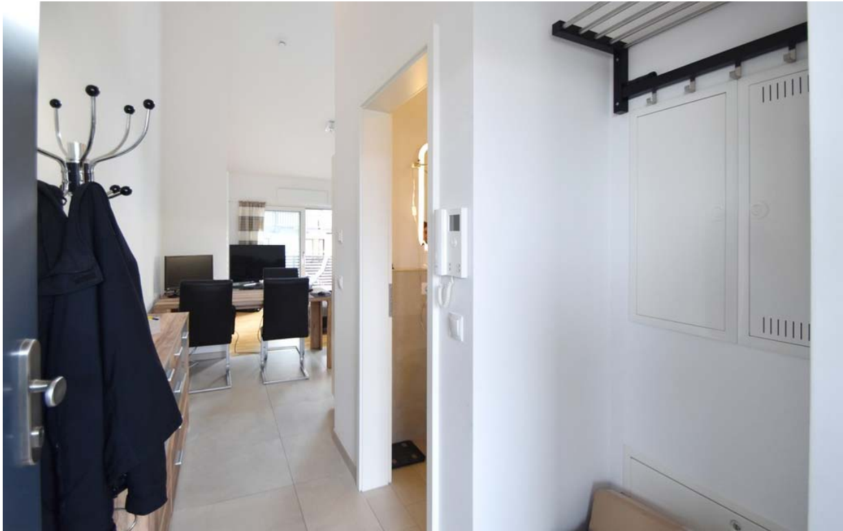
Eingangsbereich / Diele