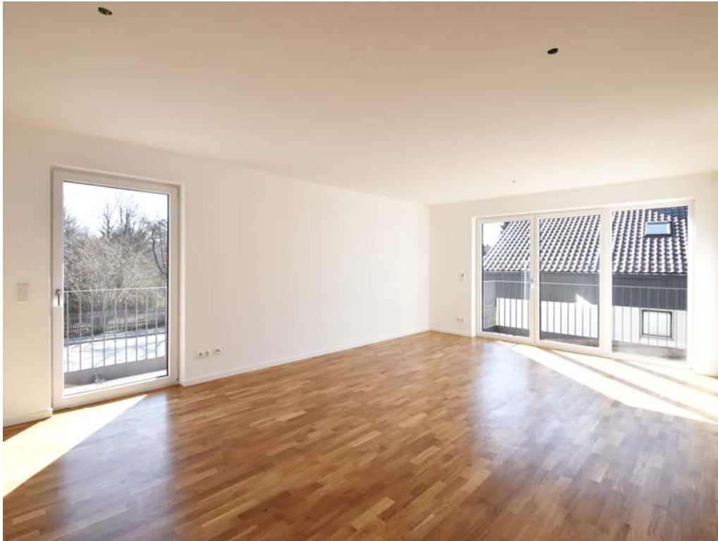
Wohnen / Essen / Küche