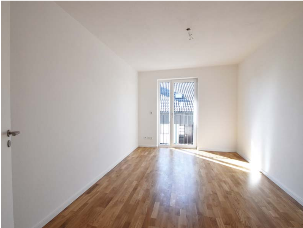
Kinderzimmer / Büro