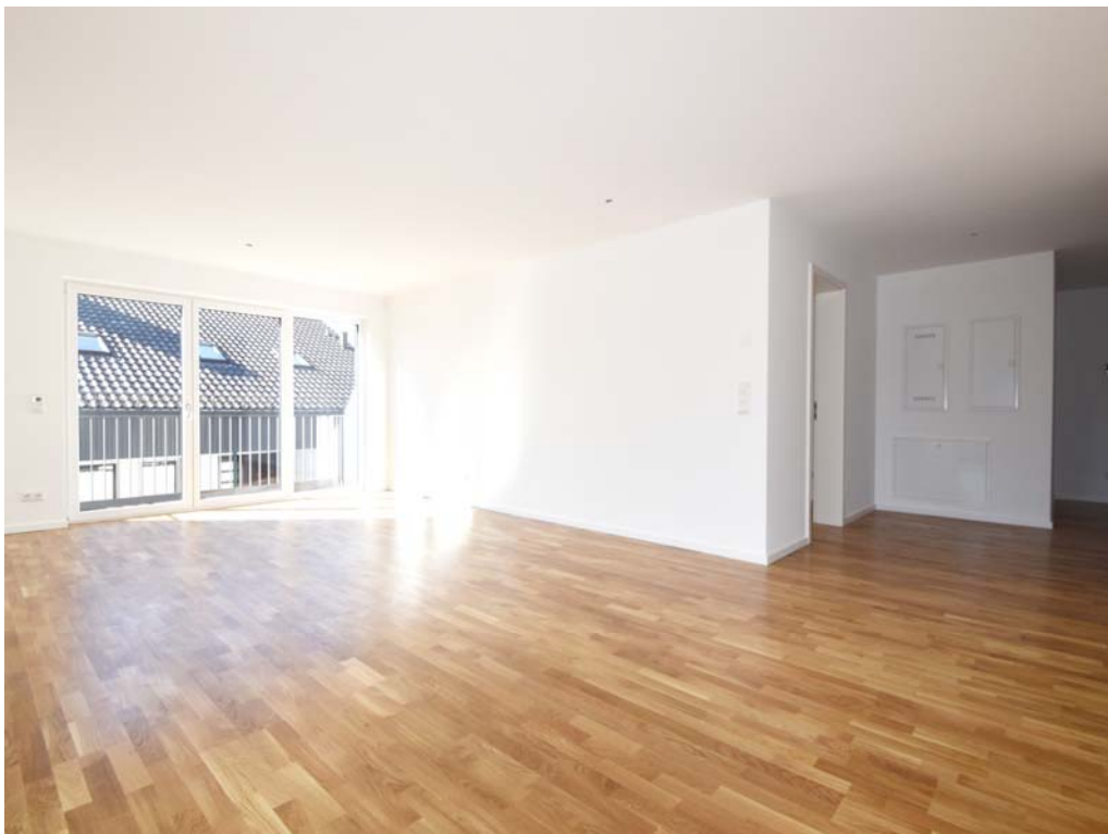
Wohnen / Essen / Küche