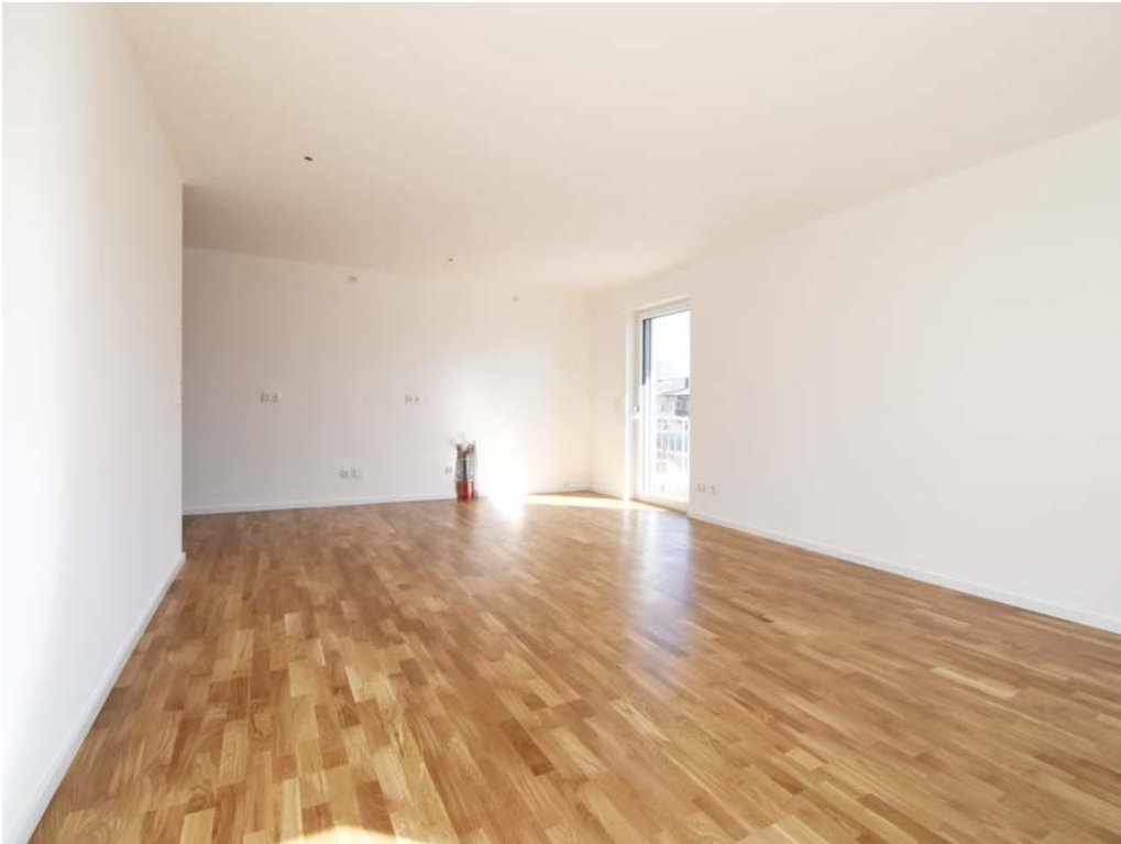
Wohnen / Essen / Küche