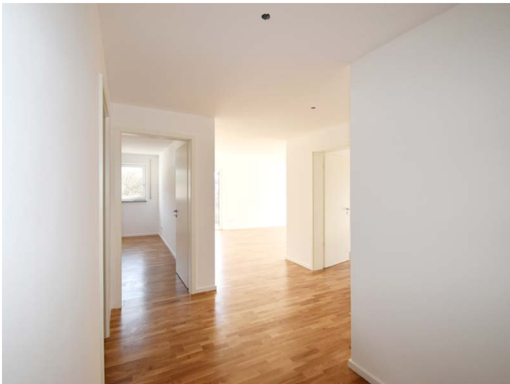
Eingangsbereich / Diele