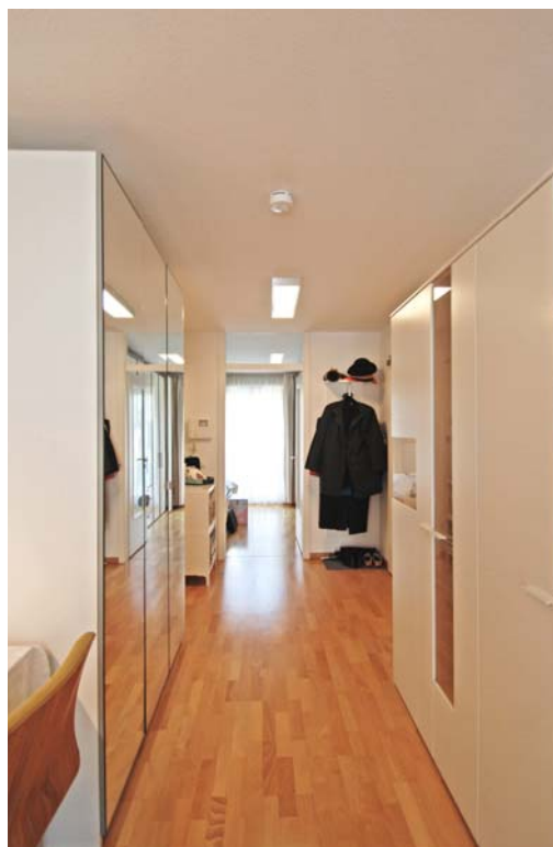
Eingangsbereich / Flur