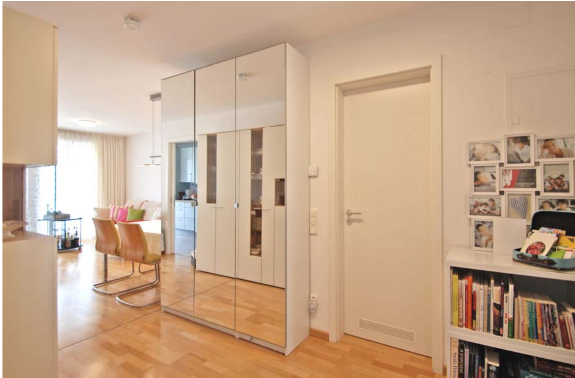
Eingangsbereich / Flur