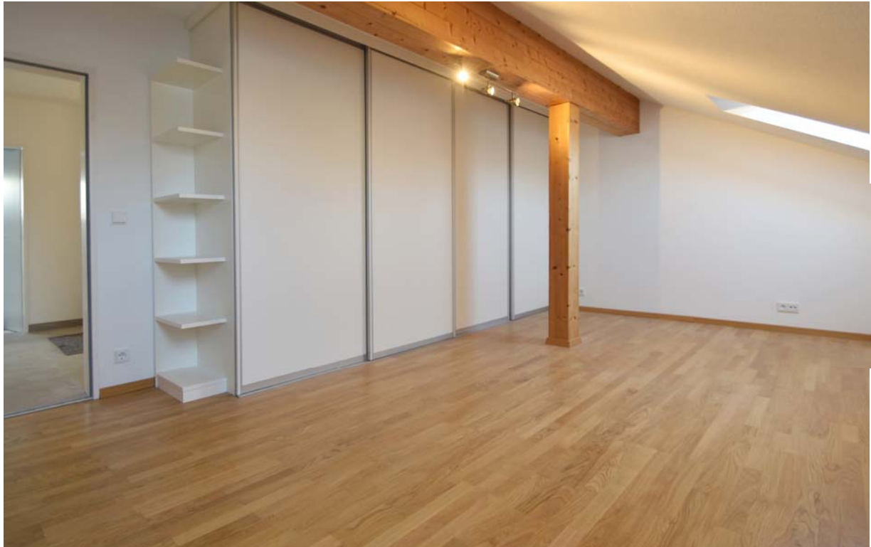
Schlafzimmer mit Einbauschrack