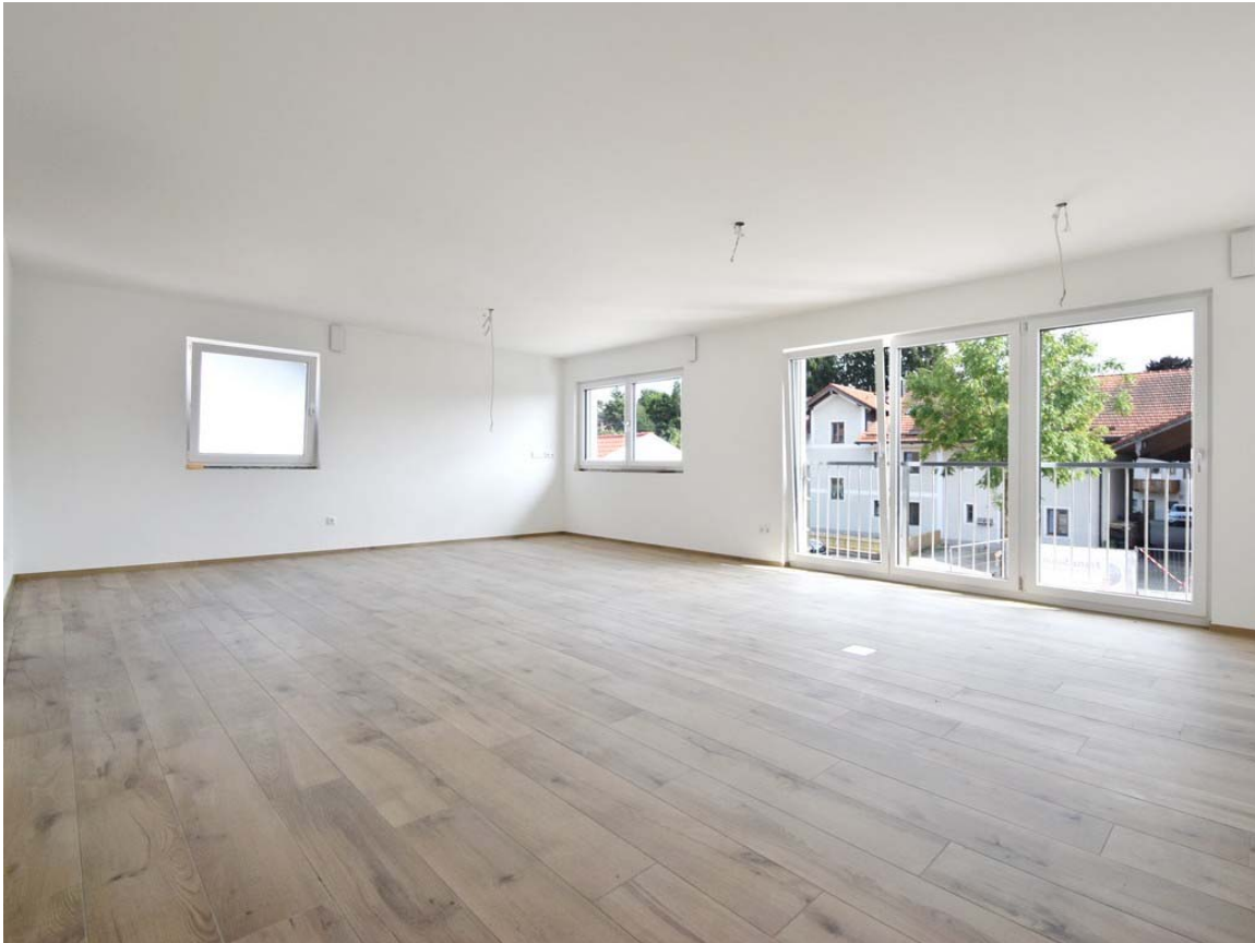
Am Mitterfeld 19 in 85658 Egming