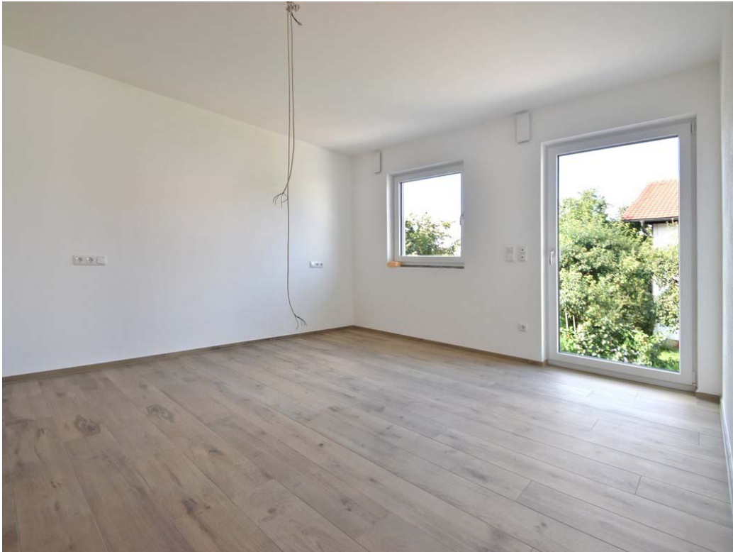
Büro / Schlafen