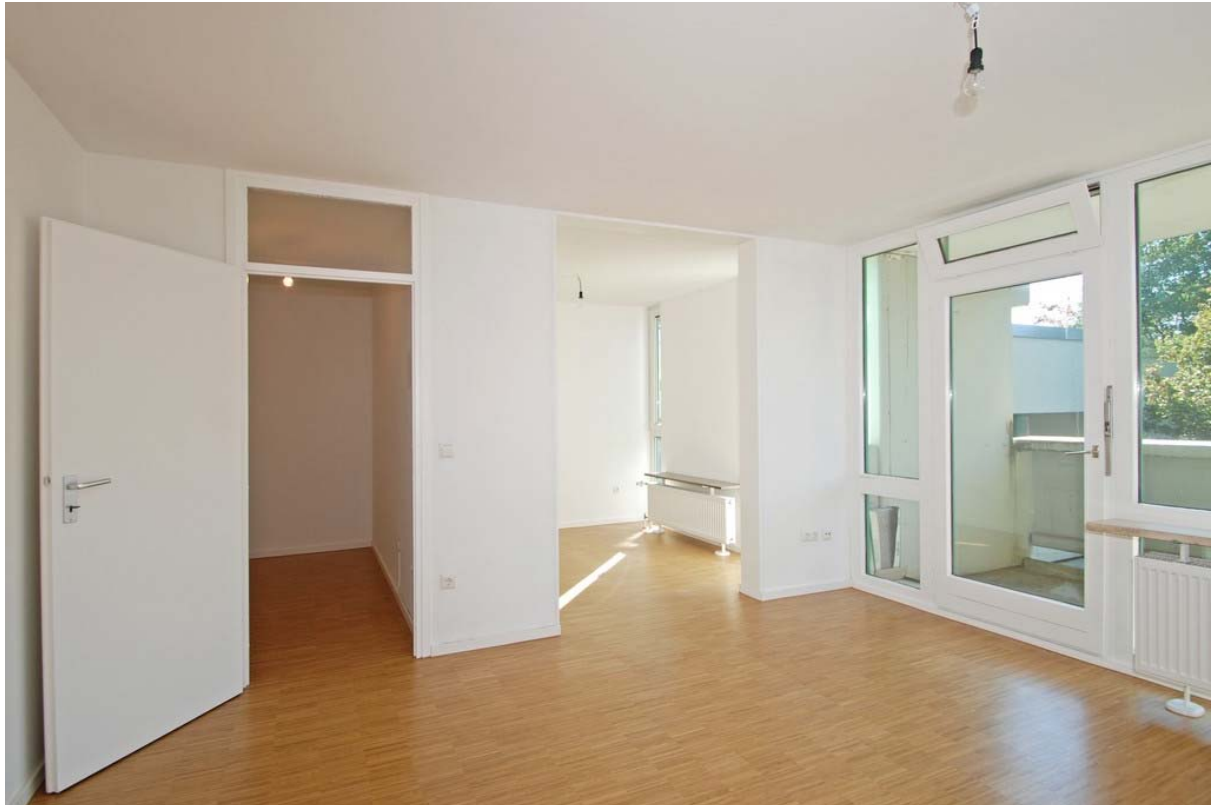
Wohn- und Schlafbereich