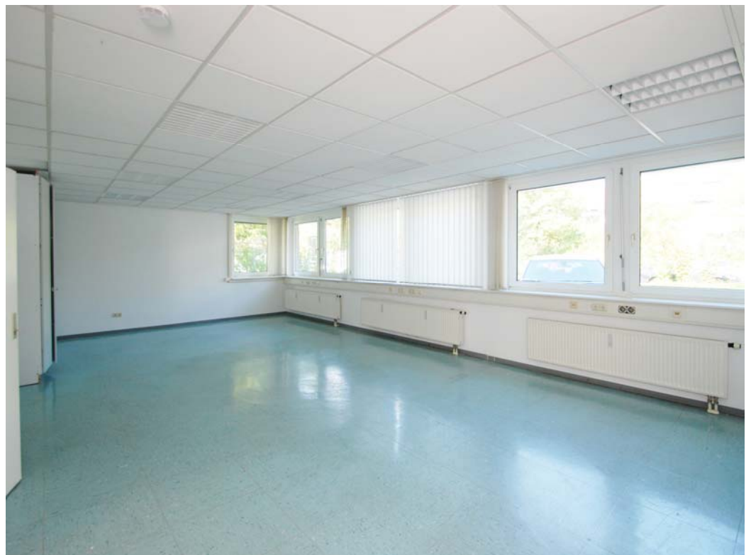
Lager / Produktion