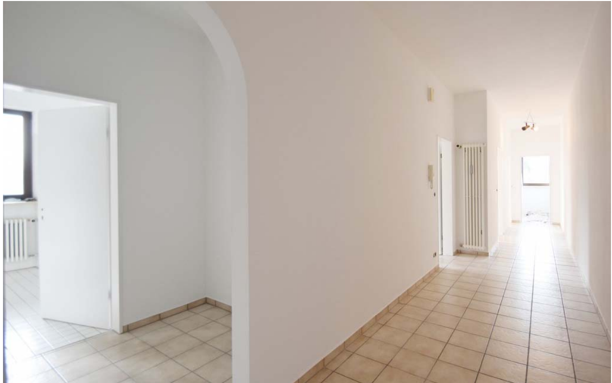
Eingangsbereich / Flur