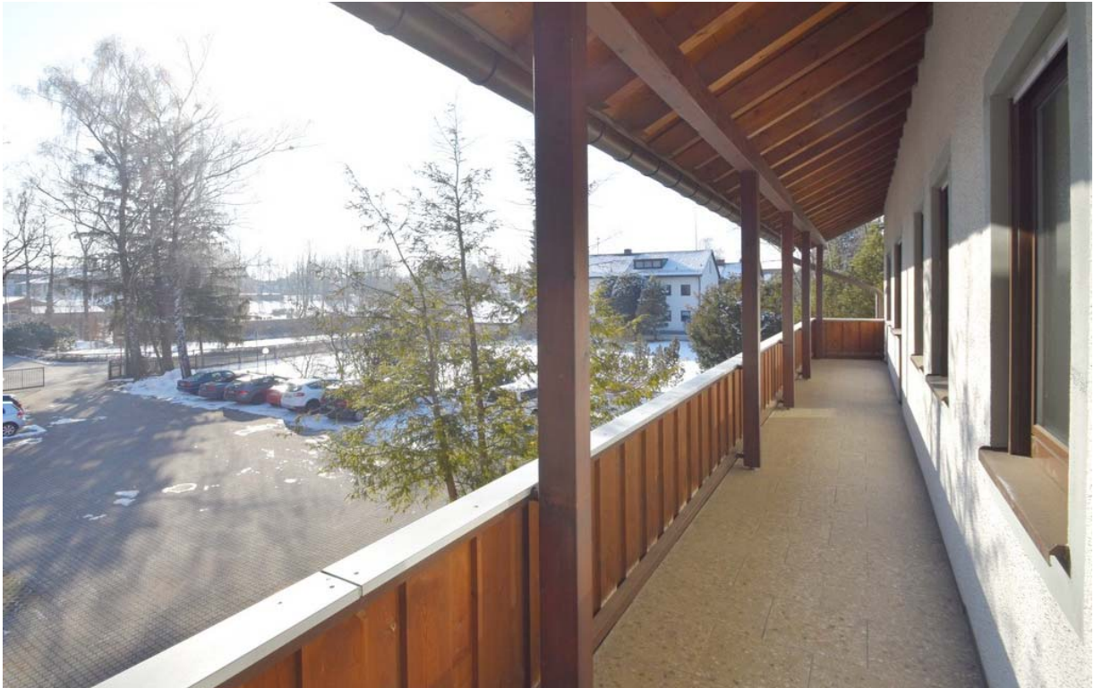
Balkon / Aussicht